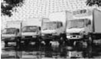
Les camions de Mitsubishi Fuso

Après que Mitsubishi Fuso, le constructeur de camions intermédiaires et poids lourds du groupe Mitsubishi, ait établi son centre des ventes et de distribution aux États-Unis il y a quelques années, ce n'était qu'une question de temps