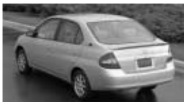
2001 Toyota Prius