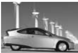
2001 Honda Insight