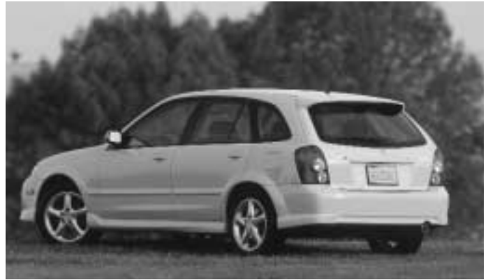
Mazda Protégé 5 – Familiale

Plus de 200 chercheurs de 28 universités canadiennes et plus de 100 partenaires industriels et gouvernementaux ont apporté leur con-