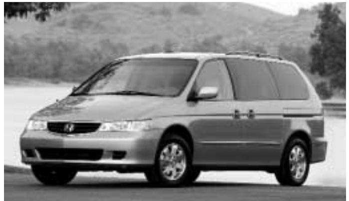
Honda Odyssey – Le choix des consommateurs (le plus de votes en général)