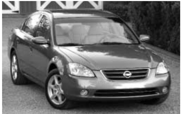
Nissan Altima SE – Automobile familiale

tribution à AUTO21. Les projets de recherche portent sur six thèmes d'étude : la santé, la sécurité et la prévention des blessures, les tissus sociétaux, les matériaux et la fabrication, les procédés de design, les groupes motopropulseurs, les carburants et émissions ainsi que les systèmes intelligents et les capteurs.