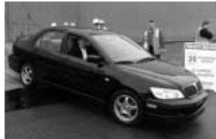
Le premier Mitsubishi Lancer arrive à Fraser Wharves à Vancouver

Au début du mois d'août, le premier envoi de véhicules Mitsubishi est arrivé à Vancouver en provenance du Japon. Les véhicules Mitsubishi seront officiellement en vente au Canada au début de septembre, selon Mitsubishi Motor