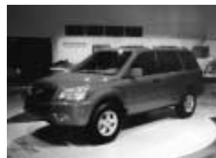
Le VUS Pilot de Honda

Dans le sillage de la récente mise en route de la toute nouvelle usine de Honda en Alabama, que Honda a désignée comme principales installations de construction de la minifourgonnette Odyssey en Amérique du Nord, Honda Canada a annoncé tout juste avant Noël que HCM à Alliston commencera la production à grande