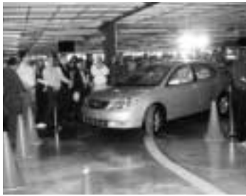
Fil d'arrivée de la chaîne de montage de la Toyota Corolla

Au début de janvier, Toyota Motor Manufacturing Canada (TMMC) a simultanément lancé deux nouveaux modèles 2003 sur la même chaîne de montage à son usine de Cambridge (Ontario) : la Corolla de neuvième génération, et son tout nouveau véhicule utilitaire à caisse transformable, la Toyota Matrix. Pour la première fois chez TMMC, les deux véhicules