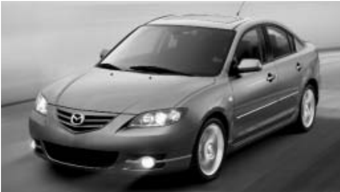
Mazda3 – Voiture de l'année et Meilleure nouvelle voiture économique