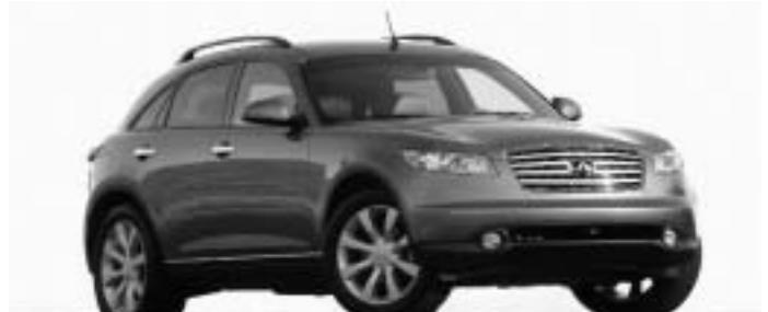
Infiniti FX45 - Meilleure nouvelle fourgonnette polyvalente/véhicule multiségment