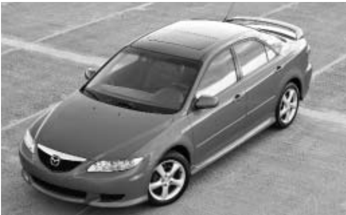
Mazda6 – Meilleur nouveau véhicule de type familial