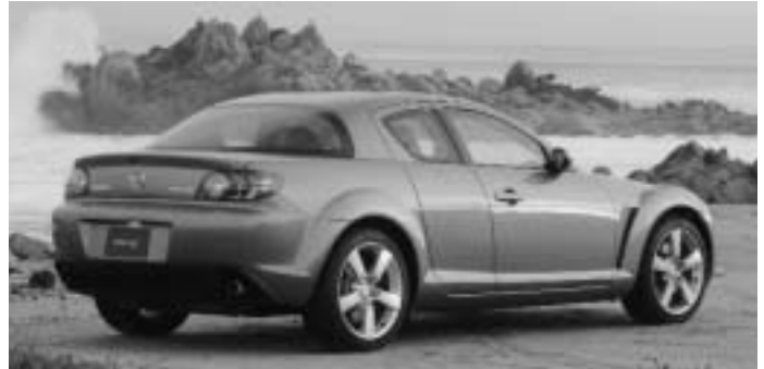
Mazda RX-8 - Meilleur nouveau véhicule combinant rendement et allure sportive