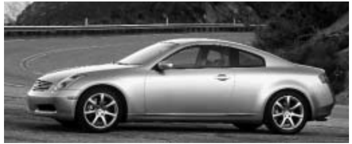
Infiniti G35 Coupe - Meilleur nouveau coupé sport de plus de 35 000 $