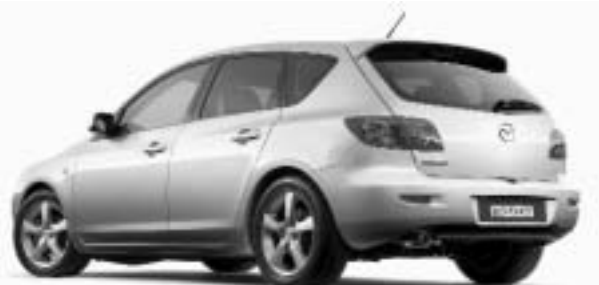
Mazda3 Sport à hayon – Meilleur nouveau coupé sport de moins de 35 000 $