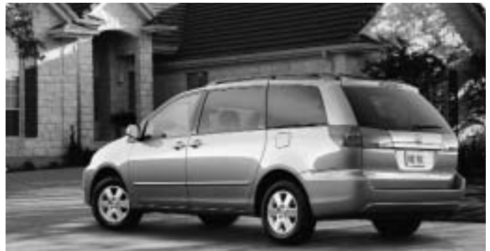
Toyota Sienna - Meilleure nouvelle fourgonnette