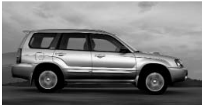
Subaru Forester 2.5 XT - Meilleur nouveau véhicule utilitaire sport