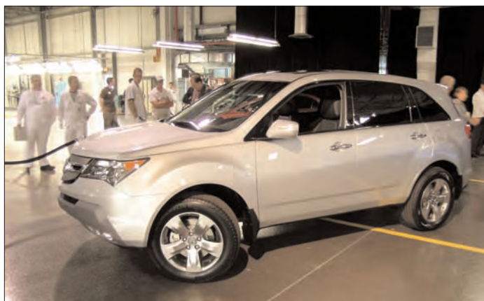
Honda (HCM) a lancé en septembre le nouvel Acura MDX 2007 à l'usine 2 d'Alliston.