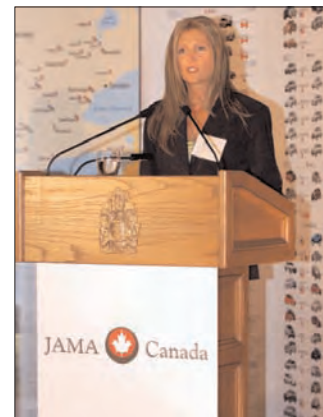
M me Helena Guergis, députée (Simcoe-Grey), Secrétaire parlementaire du ministre du Commerce international

Il faut améliorer et intégrer de façon significative l'ensemble du réseau de